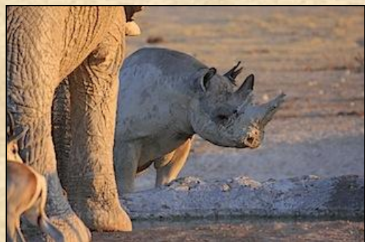
Rhinocéros noir, Etosha NP