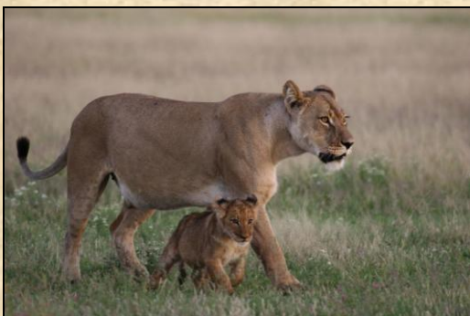
Lionne et lionceau, Etosha NP

Journée complète de safari au sein du parc qui constitue l'une des principales attractions de la Namibie avec le désert du Namib. Etosha, le «grand espace blanc», tire son nom d'Etosha Pan, une vaste dépression de 120 km de long sur 72 km de large. Cet ancien lac s'est progressivement asséché il y a environ 12 millions d'années laissant place à une vaste étendue blanche. Ce parc national offre sans conteste l'un des plus beaux tableaux de la vie sauvage d'Afrique où vivent 114 espèces de mammifères, 110 espèces de reptiles et 340 variétés d'oiseaux dont environ un tiers sont des migrateurs. De nombreux points d'eau ponctuent le parcours et permettent une observation aisée de la faune sauvage lorsque éléphants, zèbres, gnous, girafes, springboks, guépards ou lions viennent s'abreuver. Nous passons la nuit en camping à Okaukuejo à proximité d'un point d'eau éclairé la nuit, où il n'est pas rare de voir le déplacement de nombreux animaux, avec une mention spéciale pour le rhinocéros noir. Ambiance garantie notamment au coucher du soleil !