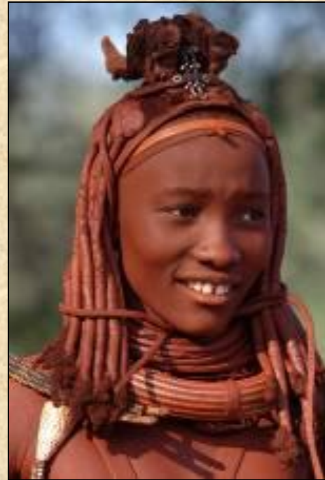
Jeune femme Himba, Kaokoland