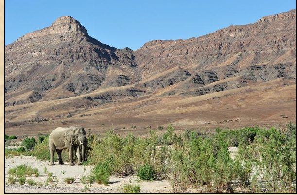
Les éléphants du désert, région du Kunene