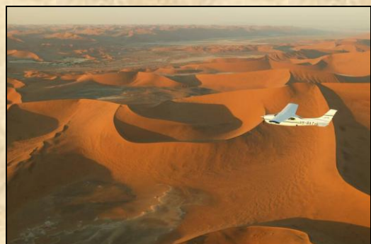
Survol du désert du Namib en avion