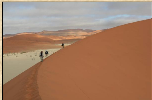
Ascension d'une des plus haute dune du monde